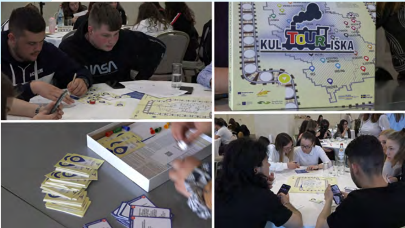
Predstavljanje KulTOURIška društvene igre

studentima i studentkinjama beogradskog i novosadskog univerziteta. Kroz ove aktivnosti, mladi ljudi koji su u procesu obrazovanja imali su priliku da steknu šira znanja o interkulturalizmu, toleranciji, o tome šta sve obuhvata pojam seksualnog nasilja i kako ga prepoznati, i što je još važnije, imali su priliku da se upoznaju s pojmom aktivizma u zajednici.