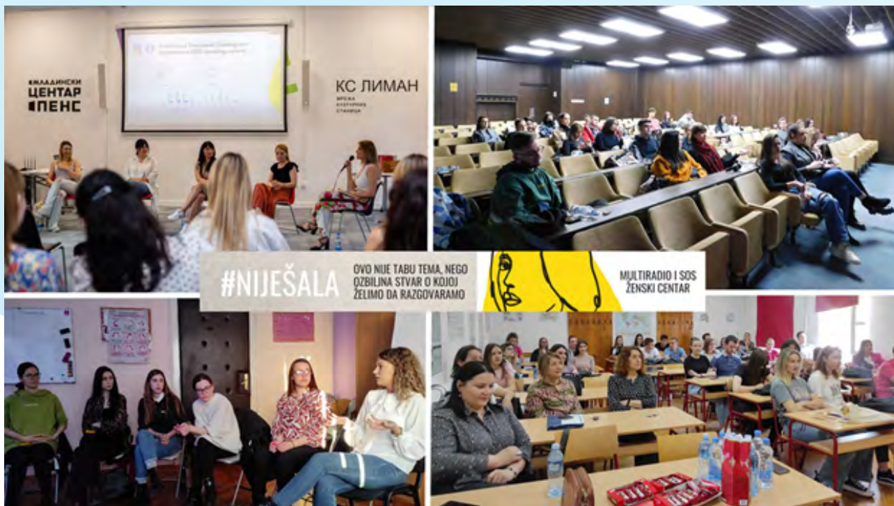
Predavanja, radionice i tribina u okviru projekta „Nije šala”

vestima, seksualnom nasilju, aktivizmu i interkulturalnosti. Osaženi mladi pokrenuli su 15 lokalnih vršnjačkih inicijativa za vreme trajanja projekta u devet različitih opština i gradova, što svedoči o preuzimanju aktivne uloge pokretača lokalnih promena razmrđavanjem svoje zajednice i osveščivanjem građana