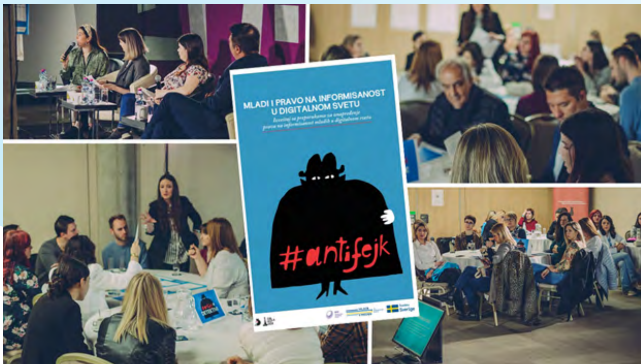
Kako do manje #fejka u digitalnim medijima – događaj

Potpomognuti partnerskim OCD za mlade, lokalni mediji su imali priliku da doprinosu profesionalnom i etičkom medijskom izveštavanju, da podignu vidljivost tema značajnih za mlade i lokalnu zajednicu, te da osnaže i mobilišu mlade kroz istraživanja, uključivanje u lokalna pitanja i kreiranje preporuka o medijskoj pismenosti.